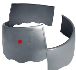
3 teilig 67 cm Ø